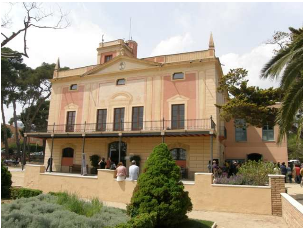
Hort d'Iglésies , La Selva del Camp