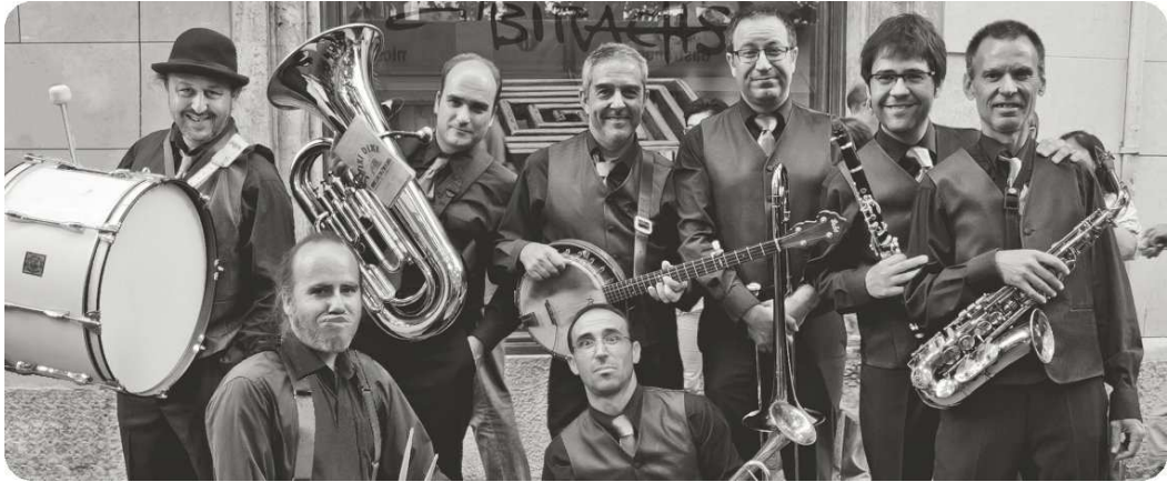
Pixi Dixi Band